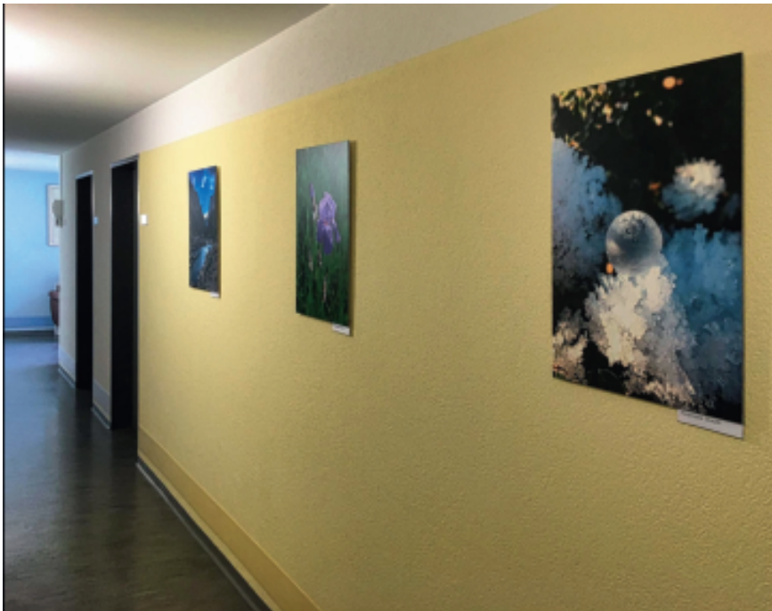
In allen Gängen und an Wänden wurden die Bilder installiert